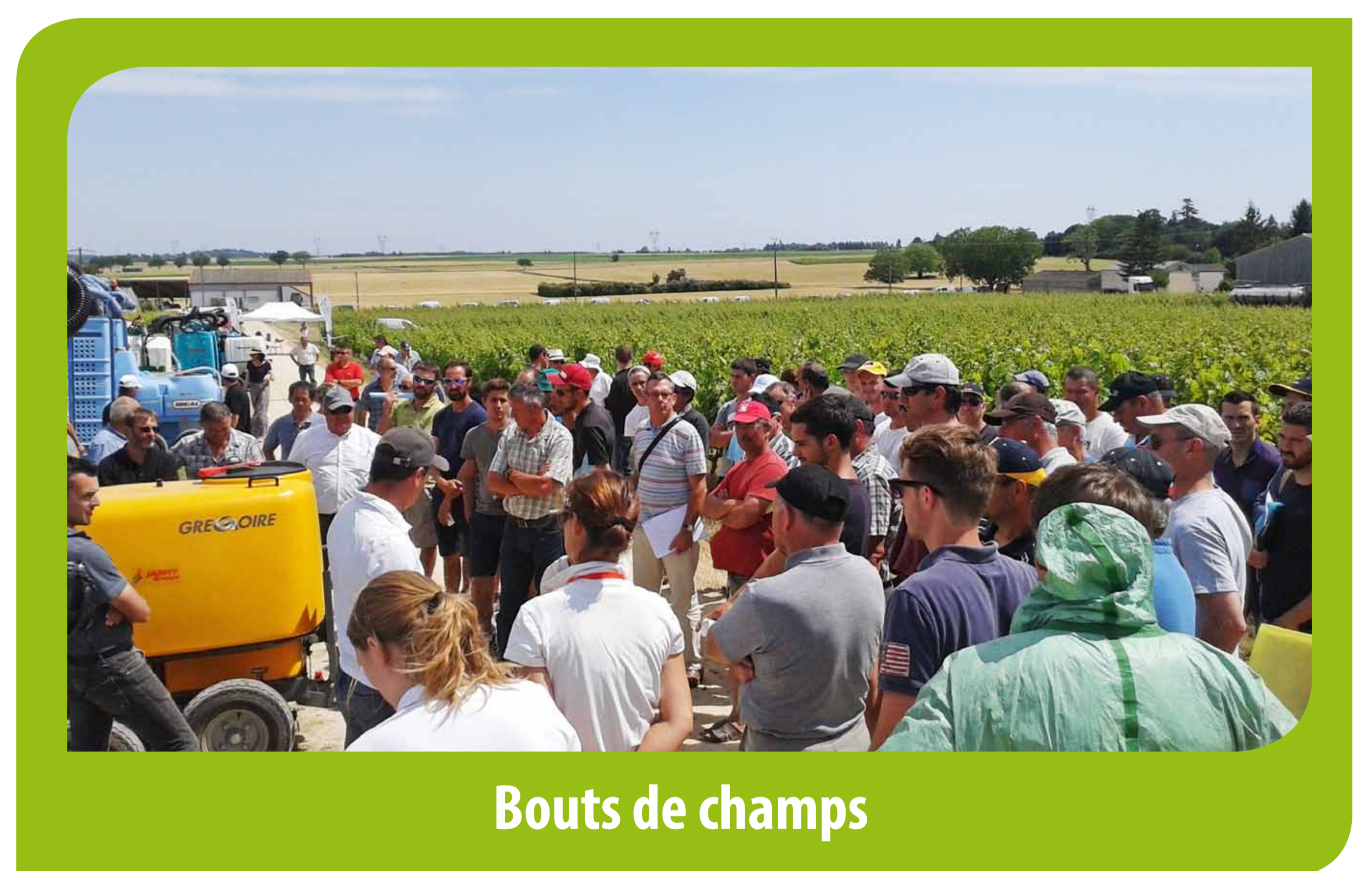
Bouts de champs