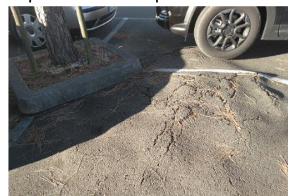
Soulèvement de chaussée sur un parking, du à un arbre planté dans une fosse trop petite (Terranjou)

- les constructions. A 2.50m des façades pour les arbres de faible gabarit (couronne inférieure à 4m) et 4m minimum pour les arbres de gabarit supérieur.