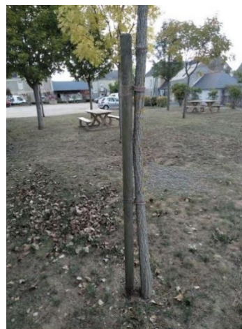
Jeune arbre tuteuré (Terranjou)