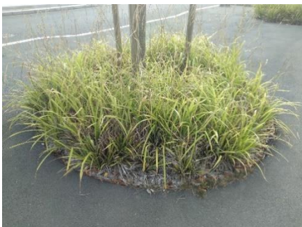
Pied d'arbre fleuri avec paillage en copeaux de bois et tuteur tripode (Angers)

- Terre végétale : préparer le sol et mettre en place la fosse avant la plantation en suivant les préconisations de la fiche 5. Penser à un guide racinaire, surtout près des voiries.