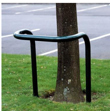
Arceau de protection double