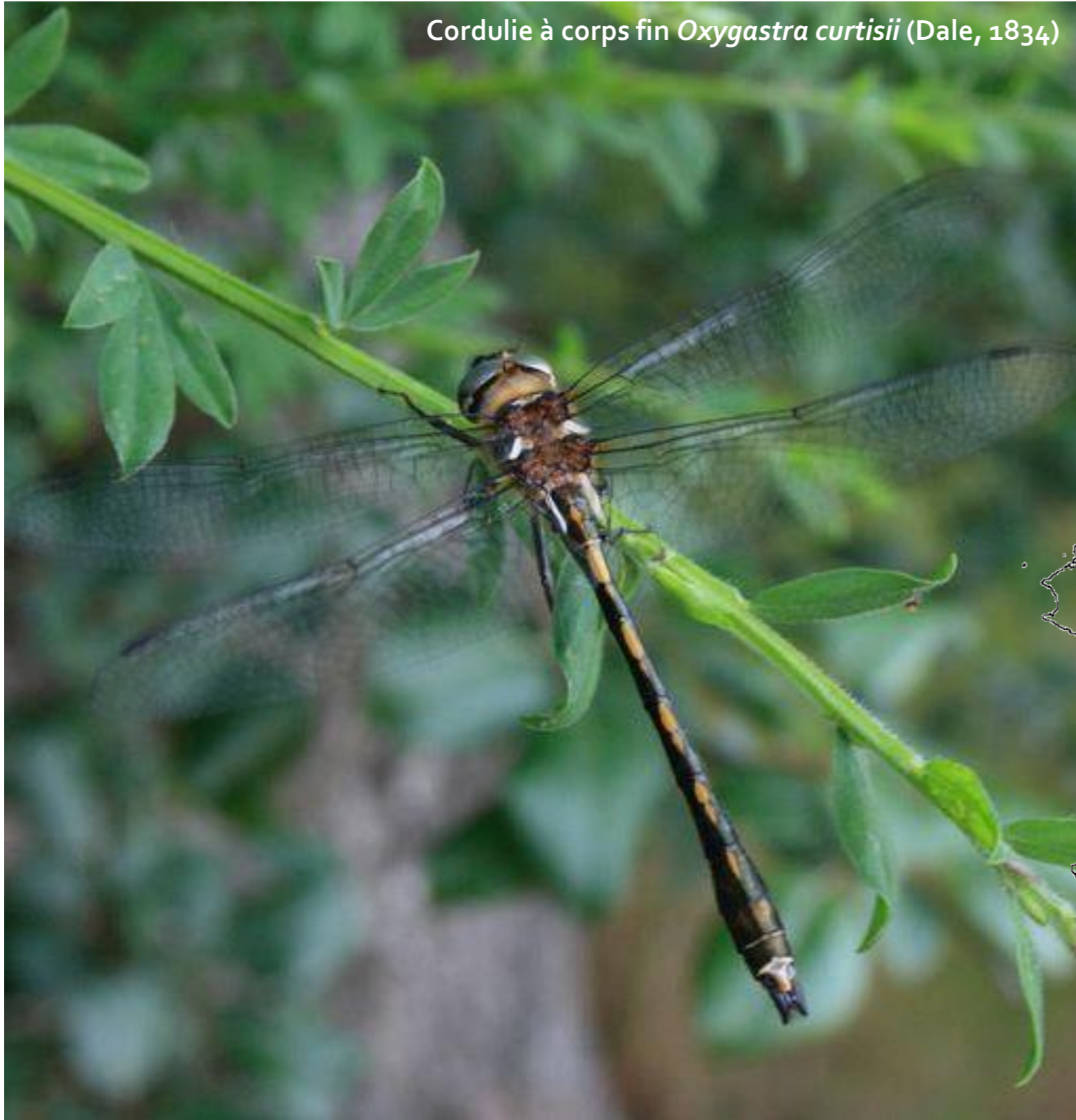
Cordulie à corps fin Oxygastra curtisii (Dale, 1834)