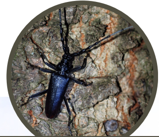
Cerambyx cerdo - Grand Capricorne

Depuis les années 50, la surface boisée a progressé au sein de la vallée, en raison notamment de l'abandon de certaines pratiques agricoles qui maintenaient les milieux ouverts. Les milieux boisés, selon leurs caractéristiques, sont de véritables supports en termes de fonctionnalités écologiques : maintien des berges, lieu de nidification, reproduction et alimentation, stockage du carbone, captage d'intrant.