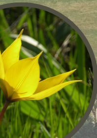
sylvestris - Tulipe sauvage

L'Espace naturel sensible de la Vallée du Layon présente une diversité floristique de premier ordre du fait de la mosaïque de ses milieux : aquatiques à xérophiles (milieux secs), calcaires à acides.