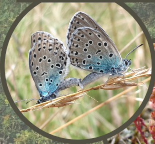
Phengaris arion - Azuré du serpolet