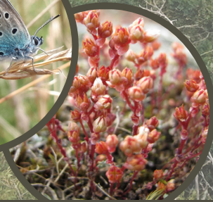
Sedum andegavense - Sedum d'Angers