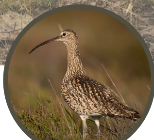
Numenius arquata - Courlis cendré

1600 , c'est le nombre d'espèces d'insectes inventoriées. Nombreuses sont celles inféodées aux milieux secs et thermophiles (milieux chauds), même si de nombreuses espèces profitent également des milieux humides présents en rive droite.